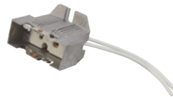
Best.-Nr. 9450041C OMNILUX Socket DX-420B for GY16 base