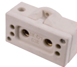
Best.-Nr. 9450050C OMNILUX Socket DX-421 für G38 base