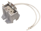
Best.-Nr. 9450030C..... GX-9,5 & GY-9,5 Best.-Nr. 94501010 ..... GY-9,5 OMNILUX Socket G-9,5