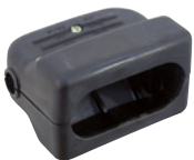
Best.-Nr. 94600200 OMNILUX PAR-SAFE nur Gehäuse Für mehr Sicherheit