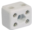
Best.-Nr. 94501000 OMNILUX Keramikklüsterklemme 2-pol mit Bef.Loeh