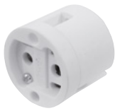
Best.-Nr. 9450045C..... für G22 base Best.-Nr. 9450046C..... für GY22 base OMNILUX Socket DX-124B