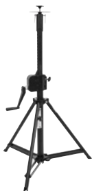
Best.-Nr. 59007121 EUROLITE STV-150A Verfolger-Stativ

Made in EU, Querträger (inkl. TV-Zapfen), Max.-Last 30 kg, Max.-Höhe 315 cm