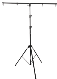
Best.-Nr. 59006985 EUROLITE A1 Stahlstativ

Preisgünstiges Stativ mit Querträger, Maximallast 14 kg, Maximalhöhe 250 cm