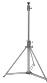
Best.-Nr. 59007123 EUROLITE STV-200 Verfolgerstativ, Edelstahl

Verfolgerstativ mit Kurbel, Maximallast 35 kg, Maximalhöhe 155 cm