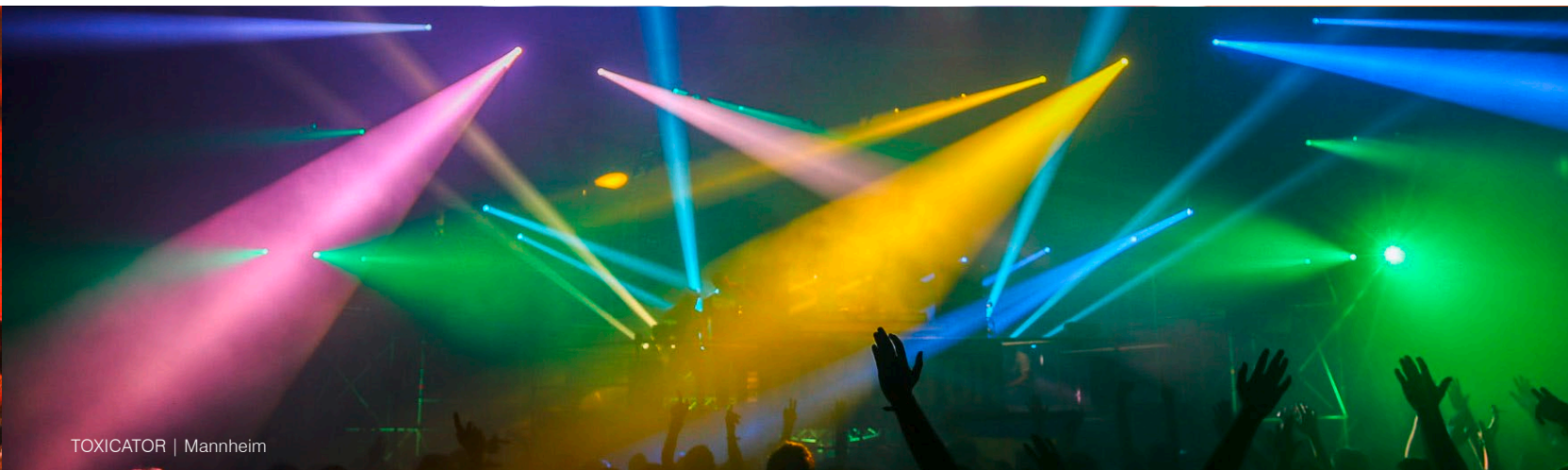
TOXICATOR | Mannheim