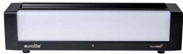
Klein, aber oho: Die Bar-6 Glow.