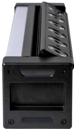
Licht in alle Richtungen. Die Bar eignet sich für viele Anwendungen.