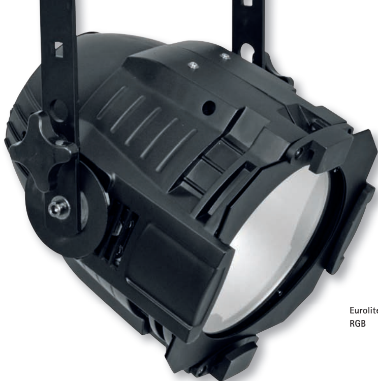
Eurolite ML-56 COB RGB