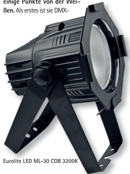
Eurolite LED ML-30 COB 3200K

Die RGB-Variante unterscheidet sich durch einige Punkte von der Weißen. Als erstes ist sie DMX-