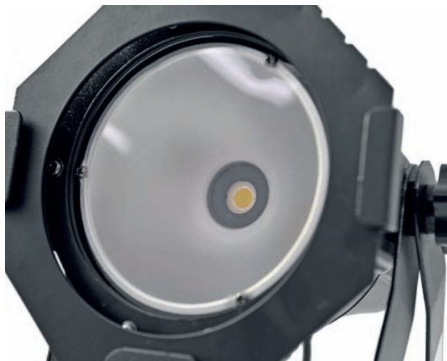
Eurolite LED ML-30 COB 3200K: Das Abstrahlverhalten wird hier ganz traditionell durch einen Reflektor optimiert.

steuerbar. Dafür sind auf der Rückseite 3-polige DMX-Buchsen, sowie ein kleines Display zum Einstellen der Funktionen und der DMX-Adresse angebracht. Hiermit lassen sich selbstverständlich auch diverse, selbst laufende Programme einstellen. Die Gesamtleistung beträgt 30 Watt, verteilt auf die drei RGB-Urfarben. Der Abstrahlwinkel ist mit 90° noch einmal deutlich breiter als bei der Weißlichtvariante – ein echtes Washlight eben. Neben dem Einsatz zur Beleuchtung kleinerer Bühnen auf sehr nahe Entfernungen eignet sich dieser Scheinwerfer auch hervorragend als Gegenlicht, mehrere davon in Richtung Publikum ausgerichtet ergeben einen satten Blinder-Effekt oder sorgen heruntergedimmt für tolle Farbstimmungen. Wem der Abstrahlwinkel zu breit ist, für den gibt es auch noch eine Par-30-Variante mit deutlich engerem Abstrahlwinkel.