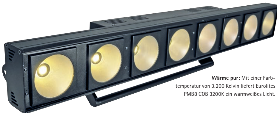
Wärme pur: Mit einer Farbtemperatur von 3.200 Kelvin liefert Eurolites PMB8 COB 3200K ein warmweißes Licht.

Das Beste kommt zum Schluss. Mein absoluter Liebling ist der Eurolite PMC 16 COB. Dieser quadratische Scheinwerfer ist eine Anordnung aus vier mal vier Leuchten, besteht also aus insgesamt 16 COB-Feldern. Erhältlich ist er als warmweiße und als RGB-Version. Und gerade die RGB-Variante begeisterte mich im Test. Schließlich vereint sie die Funktionen verschiedenster Scheinwerfer in einem