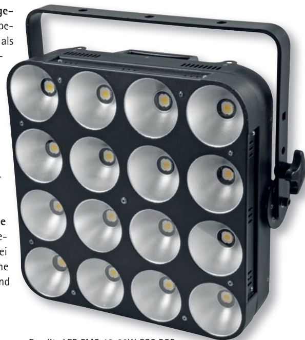
Eurolite LED PMC-16x30W COB RGB

Die kleine und die große Rampe gibt es mit Farbmischung. Es sind also vier oder acht COB-RGB-Chips mit Reflektor und mit jeweils 30 Watt Leistung in ein längliches Gehäuse gesetzt worden. Beide Versionen können im Minimalfall mit drei DMX-Kanälen gesteuert werden. Hier nimmt der komplette Scheinwerfer eine gemeinsame Farbe an. Es gibt aber auch weitere, größere DMX-Modi die die Ansteuerung jeder einzelnen Farbe in jedem Chip ermöglichen. Die RGB-Varianten eignen sich sehr gut für den schon erwähnten Rampeneinsatz aber auch zum Einsatz auf Stativ, als kompakte Lichtanlage für Bands, oder aber als farbige Blinder, als Lauf-, oder als Oberlichter und für