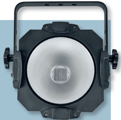
LED-COB-Scheinwerfer: Hier sieht man deutlich den LED-Chip in der Mitte eines konventionellen Reflektors.

Die COB-Technik beschert LED-Strahlern schönere Farben. Wie bei bisherigen LED-Scheinwerfern wird auch hier das Licht über monochromatische Urfarben gemischt oder bei Weißlichtvarianten über einen Leuchtstoff erzeugt. Dennoch erscheinen die COB-Farben deutlich schöner, und gerade Weißlicht und Pastelltöne geraten sauberer. Herstellerangaben zufolge liegt dies zum einen an der engen Packung der LEDs, die auf diese Weise als eine einzige Leuchtquelle wahrgenommen werden, was für das Auge die gewohnte und damit angenehmere Perspektive ist. Zum anderen produzieren die Leuchtstoffe und die Materialien, die bei dieser Bauweise eingesetzt werden andere Wellenlängen des Lichts, was den Farbtönen sehr zuträglich ist. Dies lässt sich denn auch in der Praxis äußerst eindrucksvoll beobachten.