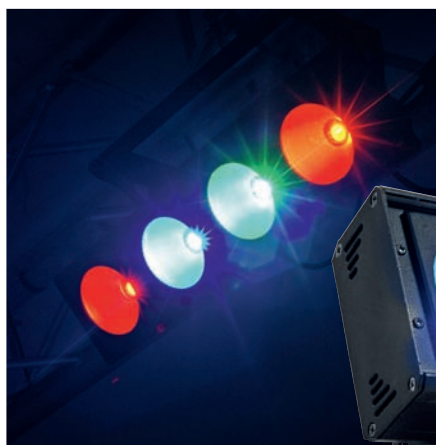
Eurolite LED PMB-4 COB