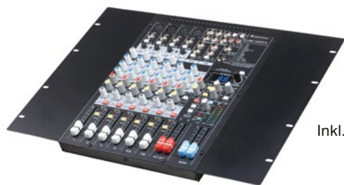
Inkl. Winkel zur Rackmontage